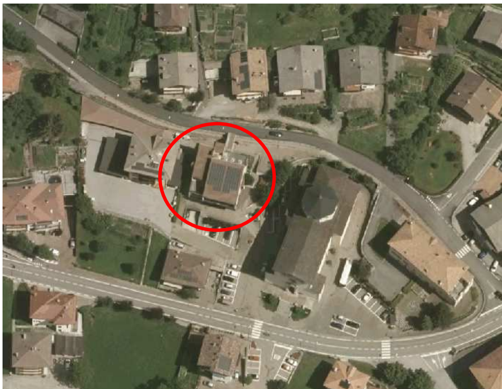
Municipio di san Lorenzo Dorsino Piazza delle Sette Ville, n. 4 San Lorenzo Dorsino